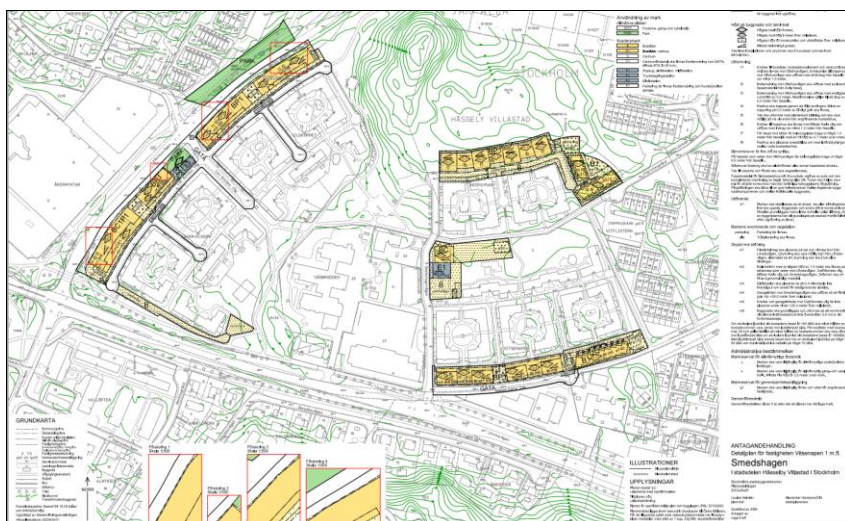
Förslag till detaljplan för Smedshagen

För området gäller en detaljplan enligt vilken fastigheterna är avsedda för markparkeringar, värmecentral, odlingslotter, park- och gatumark samt öppna gräsytor som är prickmark i gällande detaljplan, det vill säga mark som inte får bebyggas.